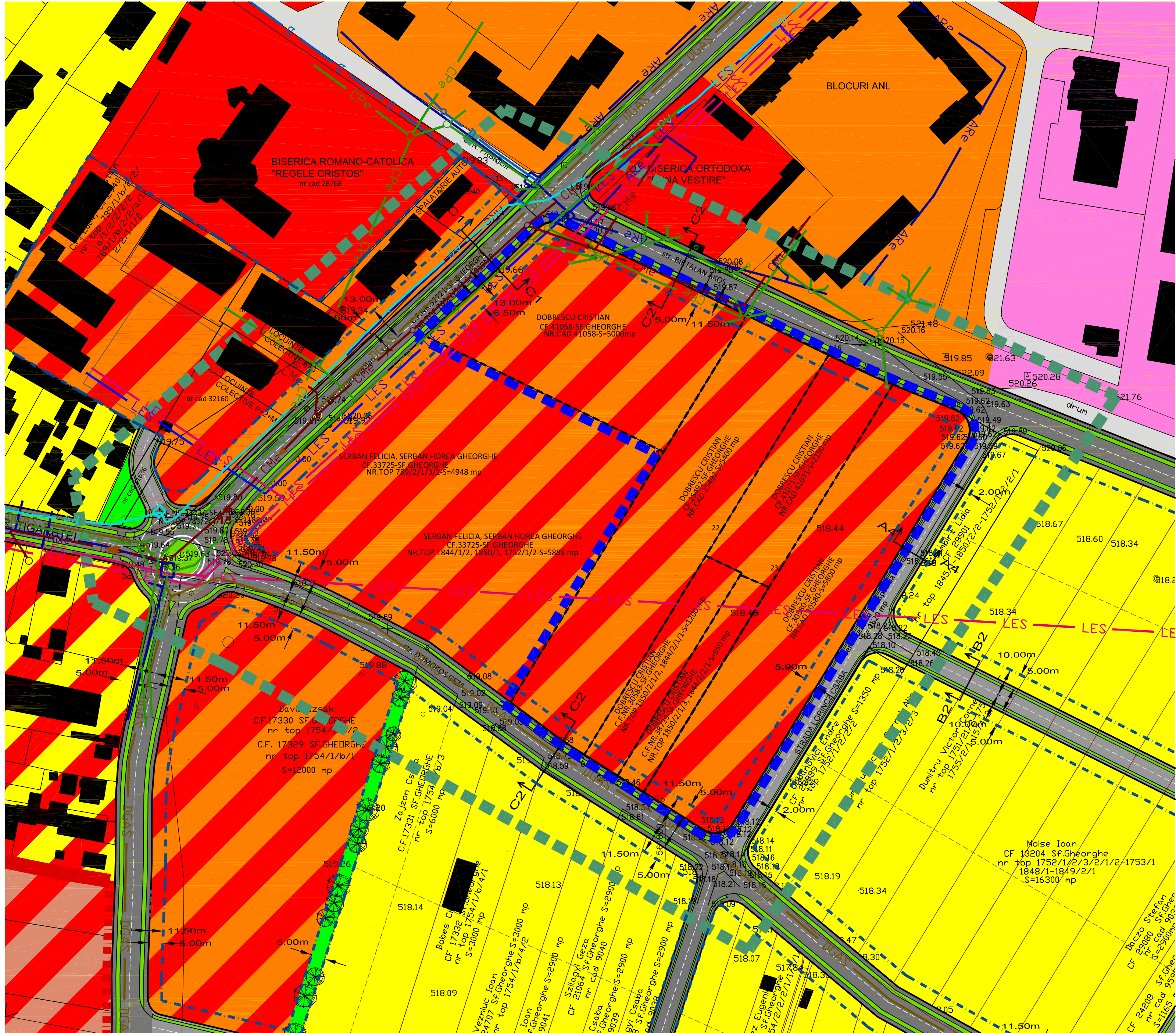
PROFILE STRAZI CONFORM P.U.Z. "LUNCA OLTULUI SUD-EST" APROBAT CU H.C.L. 299/2011