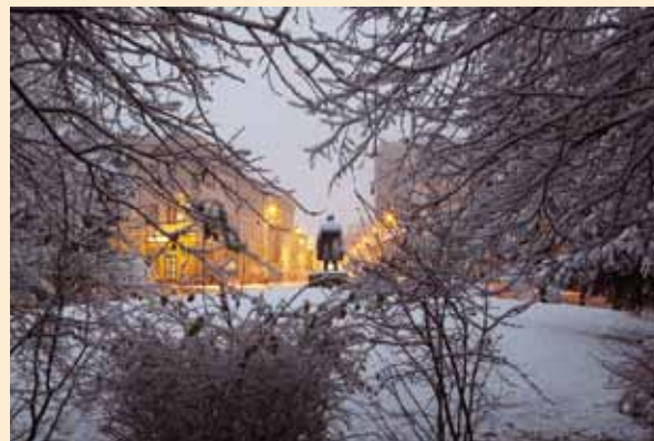
Gál Zsolt Iskola utca II. | Strada Școlii II