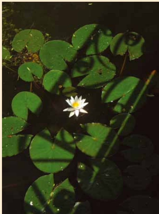
Pirampel Piroska Tavirózsa | Nufărul