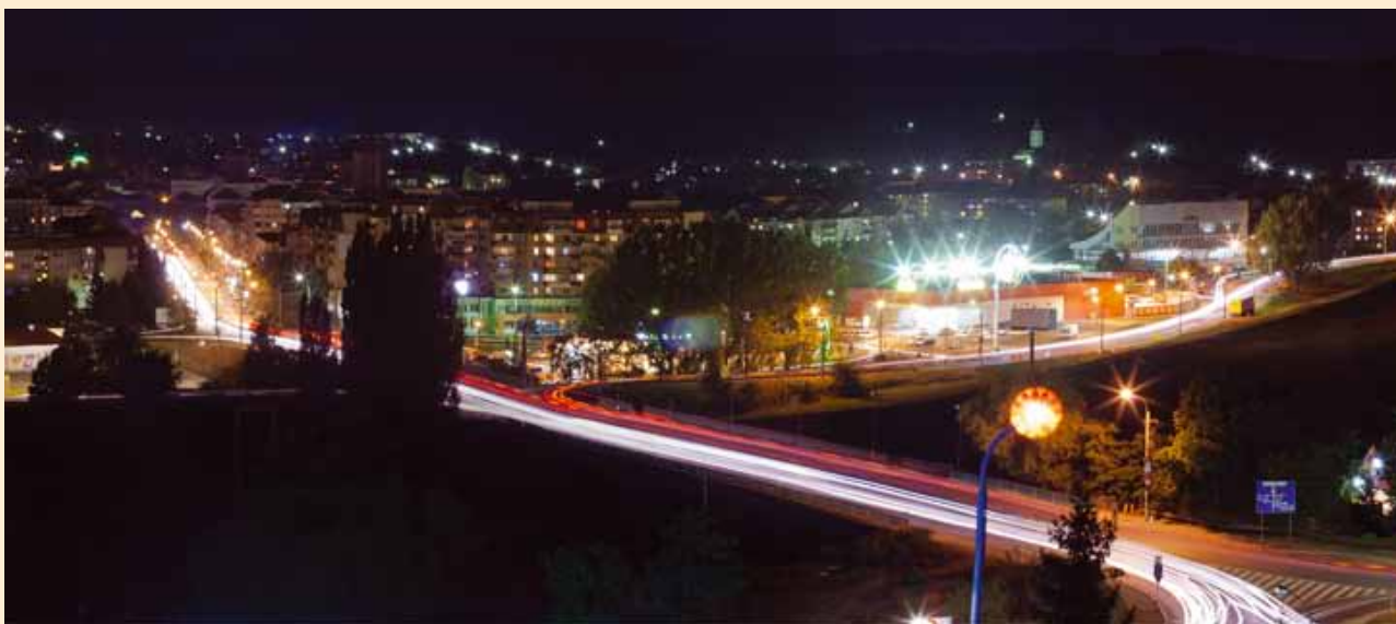
Módi István Hunor Panoráma - Panoráma részlet | Panoramă - Panoramă (fragment)