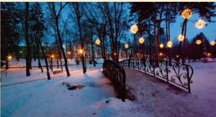
Gál Zsolt Erzsébet park: a híd | Parcul Elisabeta: podul