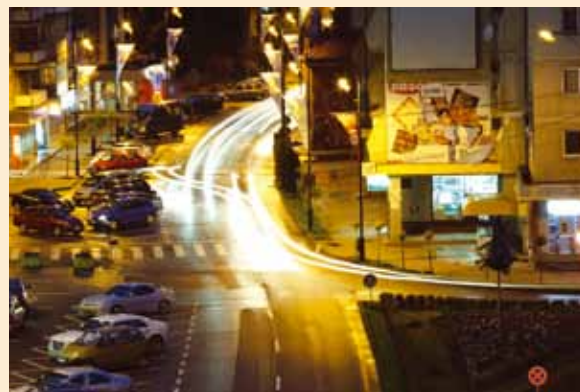
Szász-Fábián József Esti fények | Lumină nocturnă