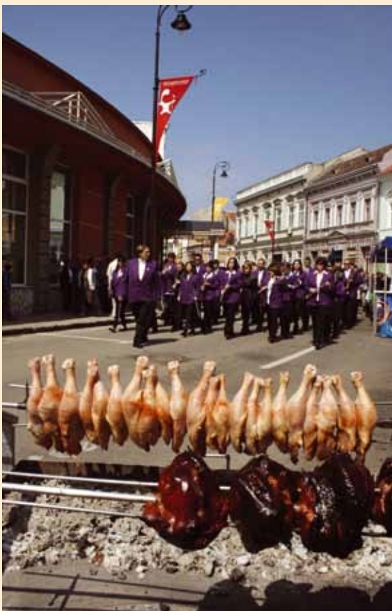
Tinca Teddy Felvonulás | Parada