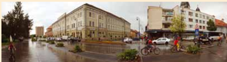
Szász-Fábián József Panoráma eső után | Panoramă după ploaie