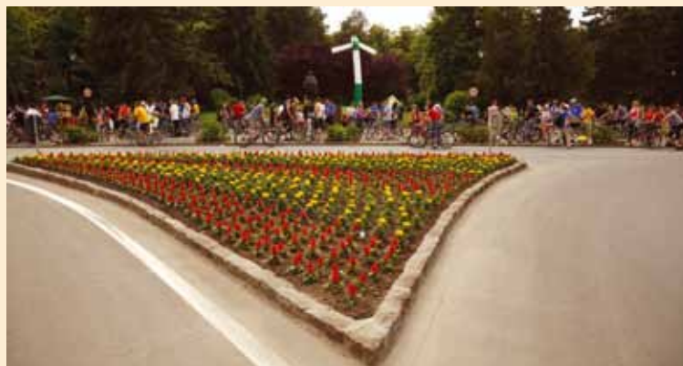
Szász-Fábián József Biciklis város | Orașul bicliștilor