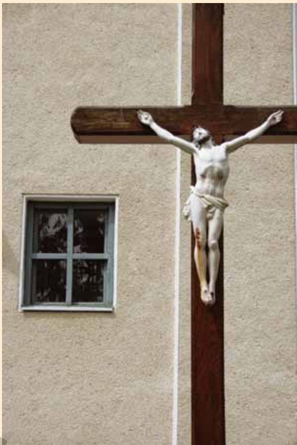
Ferencz Anikó Sepsiszentgyörgy ablakai | Ferestrelé oraşului