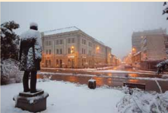
Gál Zsolt Iskola utca I. | Strada Școlii I