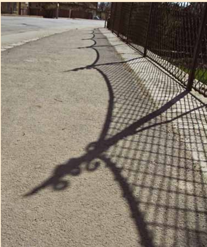
Pirampel Piroska Csipke utca | Strada Dantelei